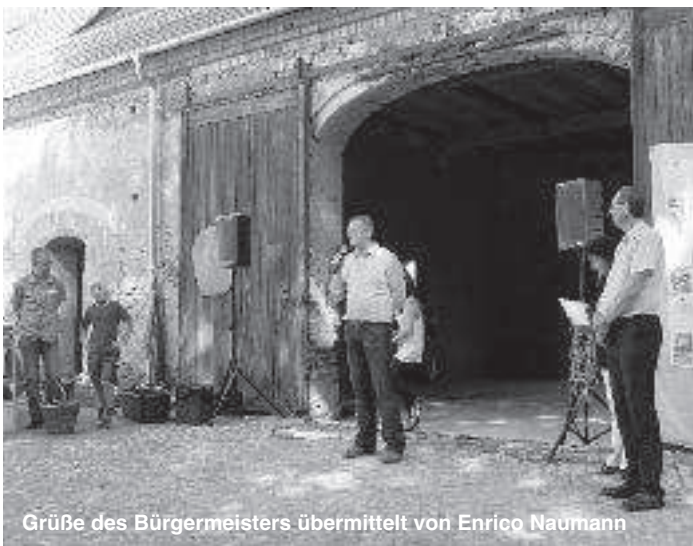
Grüße des Bürgermeisters übermittelt von Enrico Naumann