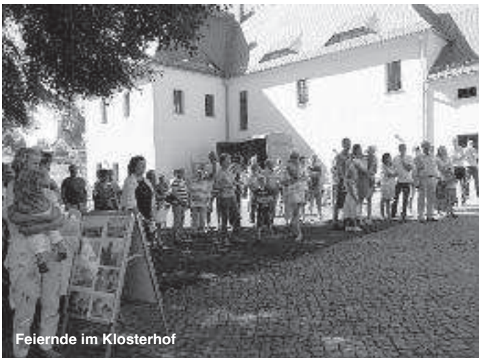
Feiernde im Klosterhof