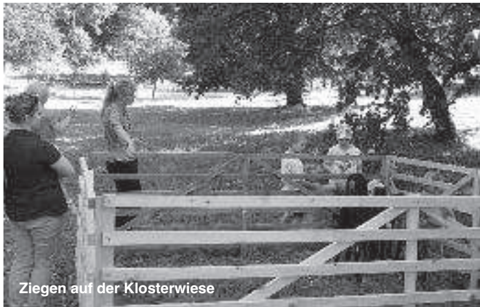
Ziegen auf der Klosterwiese