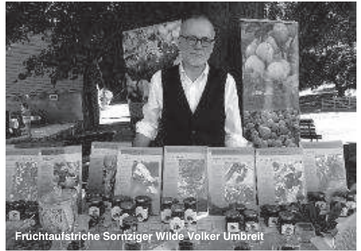
Fruchtaufstriche Sornziger Wilde Volker Umbreit